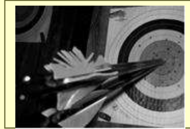
Tre pilar i mitten (tian) kallas för en "bingo".

INOMHUS genom skjutning på 25-, 18-, och 12-meter. 12-meter skjuts av skyttar upp till 12 år på 60 cm tapet, därefter mellan 13 år till 16 år skjuter man mot 40 cm tapet. Skyttar 16 år och äldre skjuter på 18 meter mot 40 cm tapet eller på 25 meter mot 60 cm tapet. Vid en tävling inomhus skjuts 2 x 30 pilar, maxpoäng blir då på den 10-ringade tavlan 600 p. Senioråldern är också indelad i klasser. Elitklass från 21 år. 50+ och 60+.