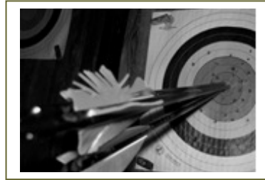
Tre pilar i mitten (tian) kallas för en "bingo".

INOMHUS genom skjutning på 25-, 18-, och 12-meter. 12-meter skjuts av skyttar upp till 13 år på 60 cm tapet, därefter mellan 13 år till 16 år skjuter man mot 40 cm tapet. Skyttar 16 år och äldre skjuter på 18 meter mot 40 cm tapet eller på 25 meter mot 60 cm tapet. Vid en tävling inomhus skjuts 2 x 30 pilar, maxpoäng blir då på den 10-ringade tavlan 600 p. Senioråldern är också indelad i klass mellan 21 år till 49 år, 50 år till 59 år och 60 år och däröver.